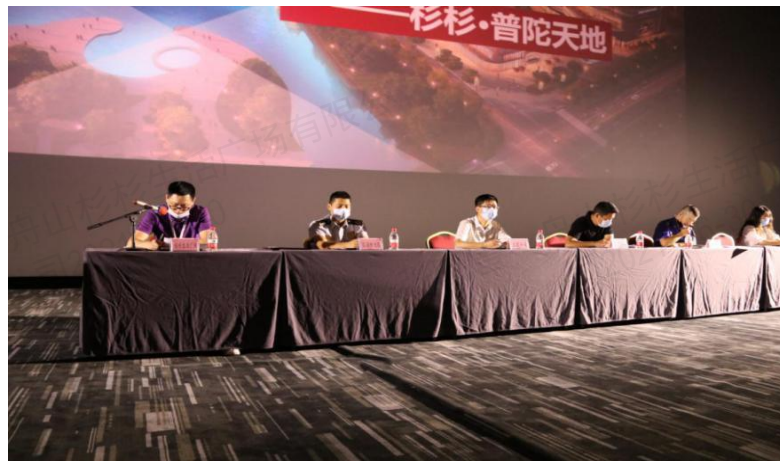
各职能部门领导作相关工作部署